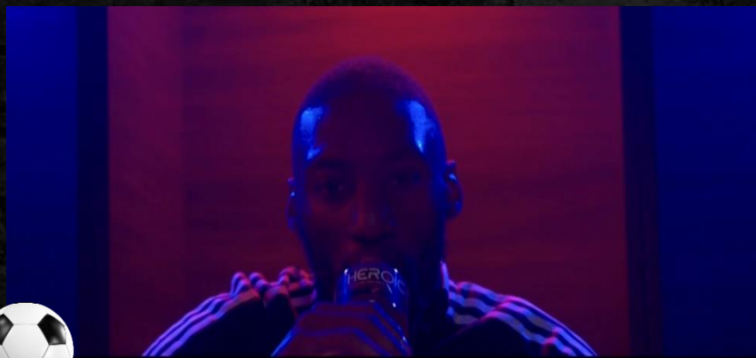
KARL TOKO-EKAMBI x HEROIC